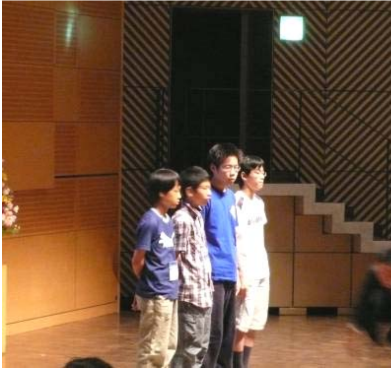
科学技術振興機構賞