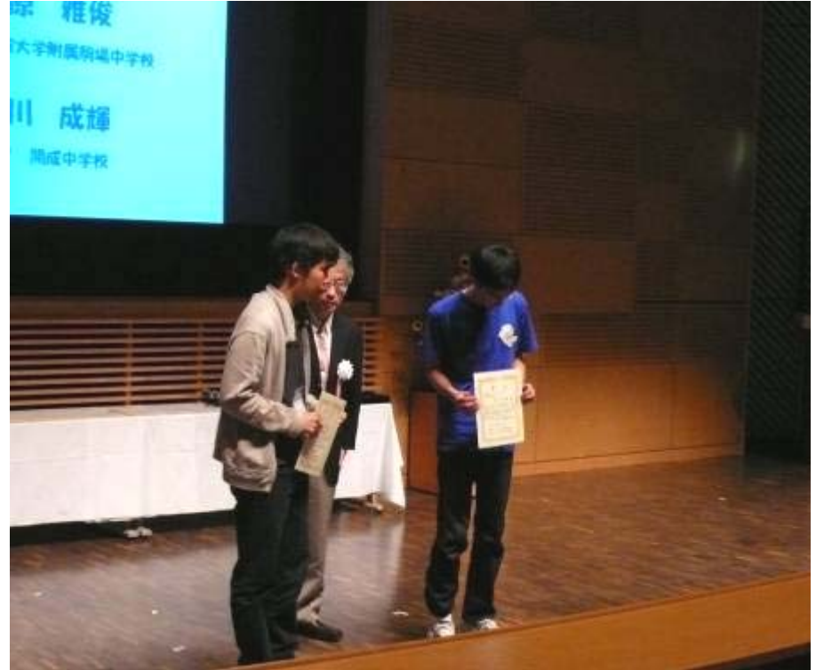
物理チャレンジ・オリンピック日本委員会特別賞

いずれも中学生のチャレンジャーに贈られました。受賞者のみなさん、おめでとう。今回の物理チャレンジは、中学生の参加者が多かったというのが一つの特徴でした。高校生にまじって果敢に挑戦してくれるのは、頼もしい限りです。