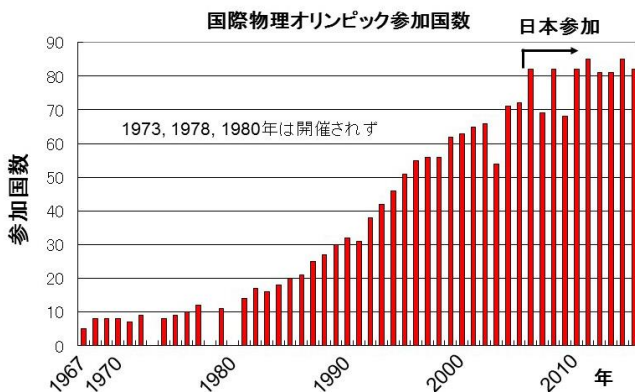
国際物理オリンピック (IPhO) 参加国数